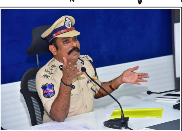
కరీంనగర్, డిసెంబర్ 30 (నేటినిజం ప్రతినీధి): నూతన సంవత్సరం వేడుకల సందర్భంగా కరీంనగర్ కమిషనరేట్ వ్యాప్తంగా ఎలాంటి అవాంఛనీయ సంఘటనలు చోటుచేసుకోకుండా పగద్దుండి చర్యలు తీసుకుంటున్నామని కరీంనగర్ పోలీస్ కమిషనర్ వి సత్యనారాయణ అన్నారు. అన్ని చర్యల ప్రజలు నూతన సంవత్సరం వేడుకలను శాంతియుత వాతావరణంలో జరుపుకోవాలని చెప్పారు.

ఉన్న వేలాది సిసి కెమెరాలతోపాటు అదనంగా సిసి కెమెరాలను ఏర్పాటు చేయనున్నామని కమిషనరేట్ వరదలో 50 మీడియా చిత్రకరణ బ్యూచాలు, డ్రోన్ కెమెరాలను రంగంలోకి దింపనున్నాము. నిర్దేశంగా వాహనాలు నడిపే వారిలోపాటు రోడ్డు నియమ నిబంధనలు పాటించని వాహనచోదకులు వాహనాలను సీజ్ చేయడం జరుగుతుంది. రోడ్లపై కేకలు, తలవ్రాసే కేకలు కట్టేయడం, రోడ్లపై సాంప్రదించుకో న్నత్యాలు చేయడం, రంగులు చల్లుకుంటూ రోడ్లపై వెళ్ళే ఇతరులకు ఇబ్బంది కలిగించడం వంటివి చేసే వారిపై చట్టపరంగా చర్యలు తప్పవని హెచ్చరించారు.