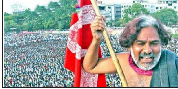
హైదరాబాద్, జనవరి 30 (ఎక్స్ ప్రెస్ న్యూస్): కాంగ్రెస్ అధికారంలోకి వచ్చిన వెంటనే హైదరాబాద్ ట్యాంకబండ్ పై ప్రజాకవి గద్దర్ విగ్రహాన్ని ఏర్పాటు చేస్తానని రేవంత్ రెడ్డి ఇచ్చిన మాటను నిలబెట్టుకున్నారు. ప్రజాయుద్ధ

- గ్రీన్ సిగ్నల్ ఇచ్చిన ప్రభుత్వం.. మాటను నిలబెట్టుకున్న రేవంత్ రెడ్డి