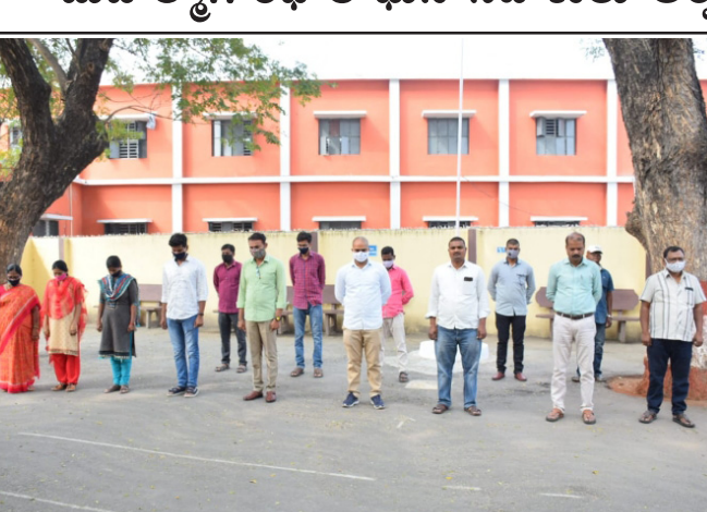
రాజన్న సిరిసిల్లా, జనవరి 30 (నేటినిజం ప్రతినది): జాతిపిత మహాత్మా గాంధీ వర్ధంతి పురస్కరించుకుని భారత స్వతంత్ర పోరాటంలో ప్రాణాలర్పించిన మహానీయుల అమరవీరులు త్యాగాలను స్ఫురిస్తూ వారి ఆత్మశాంతి కోసం శనివారం ఉదయం 11:00 గంటలకు జిల్లా పోలీస్ కార్యాలయ ఆవరణలో రెండు నిమిషాలు వాసం పాటించారు. ఈ సందర్భంగా అధికారులు మాట్లాడుతూ స్వాతంత్ర్య కారకుల త్యాగాలు చేసిన అమరవీరులకు మనం ఎల్లవేళలా బుజుబడి ఉండాలని, ప్రతి ఒక్కరూ శ్రమించడమూ, సేవా దృక్పథమూ, ఆధ్యాత్మిక దృక్పథమూ మన జీవితంలో ప్రధానాంశాలు తెలిపారు. గాంధీ ఆశయ సాధనకు ప్రతి ఒక్కరూ కృషి చేయాలని చెప్పారు.

అందుకు సాధనకు ప్రతి ఒక్కరూ కృషి చేయాలి. మహాత్మాగాంధీ కి ఘన నివాళులు అర్పించి పోలీసులు. రాజన్న సిరిసిల్లా, జనవరి 30 (నేటినిజం ప్రతినది): జాతిపిత మహాత్మా గాంధీ వర్ధంతి పురస్కరించుకుని భారత స్వతంత్ర పోరాటంలో ప్రాణాలర్పించిన మహానీయుల అమరవీరులు త్యాగాలను స్ఫురిస్తూ వారి ఆత్మశాంతి కోసం శనివారం ఉదయం 11:00 గంటలకు జిల్లా పోలీస్ కార్యాలయ ఆవరణలో రెండు నిమిషాలు వాసం పాటించారు. ఈ సందర్భంగా అధికారులు మాట్లాడుతూ స్వాతంత్ర్య కారకుల త్యాగాలు చేసిన అమరవీరులకు మనం ఎల్లవేళలా బుజుబడి ఉండాలని, ప్రతి ఒక్కరూ శ్రమించడమూ, సేవా దృక్పథమూ, ఆధ్యాత్మిక దృక్పథమూ మన జీవితంలో ప్రధానాంశాలు తెలిపారు. గాంధీ ఆశయ సాధనకు ప్రతి ఒక్కరూ కృషి చేయాలని చెప్పారు.