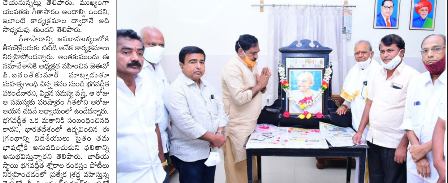
వరంగల్, జనవరి 30 (నేటినిజం): జాతిపిత గాంధీజీ అనుసరించిన ఆచారం, సత్యాగ్రహం ద్వారానే లోకకల్యాణం