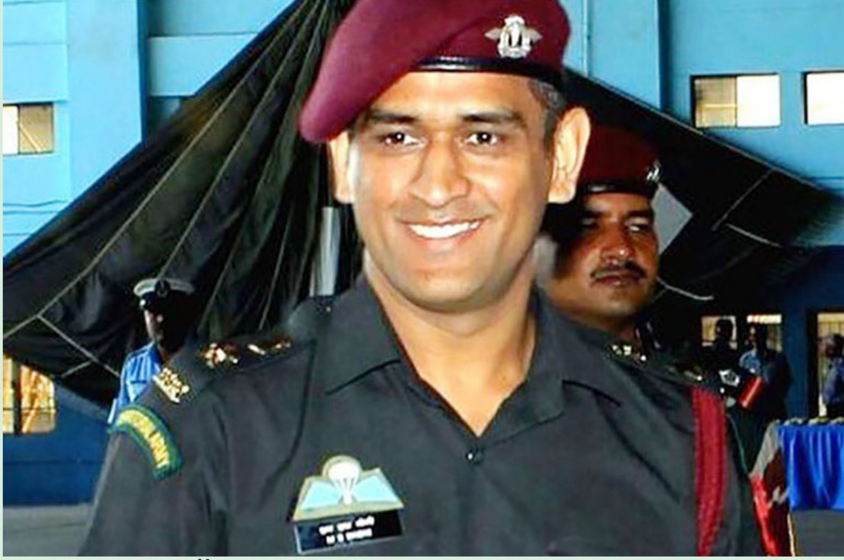
హైదరాబాద్: క్రికెటర్ ధోనీ.. ఇప్పుడు లెఫ్టినెంట్ కల్చల్ కలవనున్నాడు. బాధ్యతలు చేపట్టనున్నాడు. కశ్మీర్లో ఉద్యోగం చేసేందుకు అతను వెళ్తున్నాడు. వెస్టిండీస్ టూరిజం దూరంగా ఉన్న ధోనీ.. ఈనెల 31వ తేదీ నుంచి ఆగస్టు 15వ తేదీ వరకు 106 టెరిటోరియల్ ఆర్మీ బెటాలియన్తో కలిసి ధోనీ పనిచేయనున్నాడు. కశ్మీర్లో ఉన్న విక్టర్ ఫోర్ట్ క్రికెటర్ కలవనున్నాడు. పెట్రోలింగ్, గార్డ్, పోస్ట్ ద్యూటీలను ధోనీ నిర్వహిస్తాడు. కల్చల్ ధోనీ.. అక్కడే భద్రతా దళాలతో 15 రోజులు గడపనున్నాడు. క్రికెట్కు ధోనీ ఇప్పుడే వీడ్పాలు పలకట్టడని, పారామిలటరీ రెజిమెంట్లో సేవలందించేందుకు రెండు నెలల సెలవు మాత్రమే తీసుకుంటున్నట్లు ఇటీవల టీవీసీబి వెల్లడించింది.