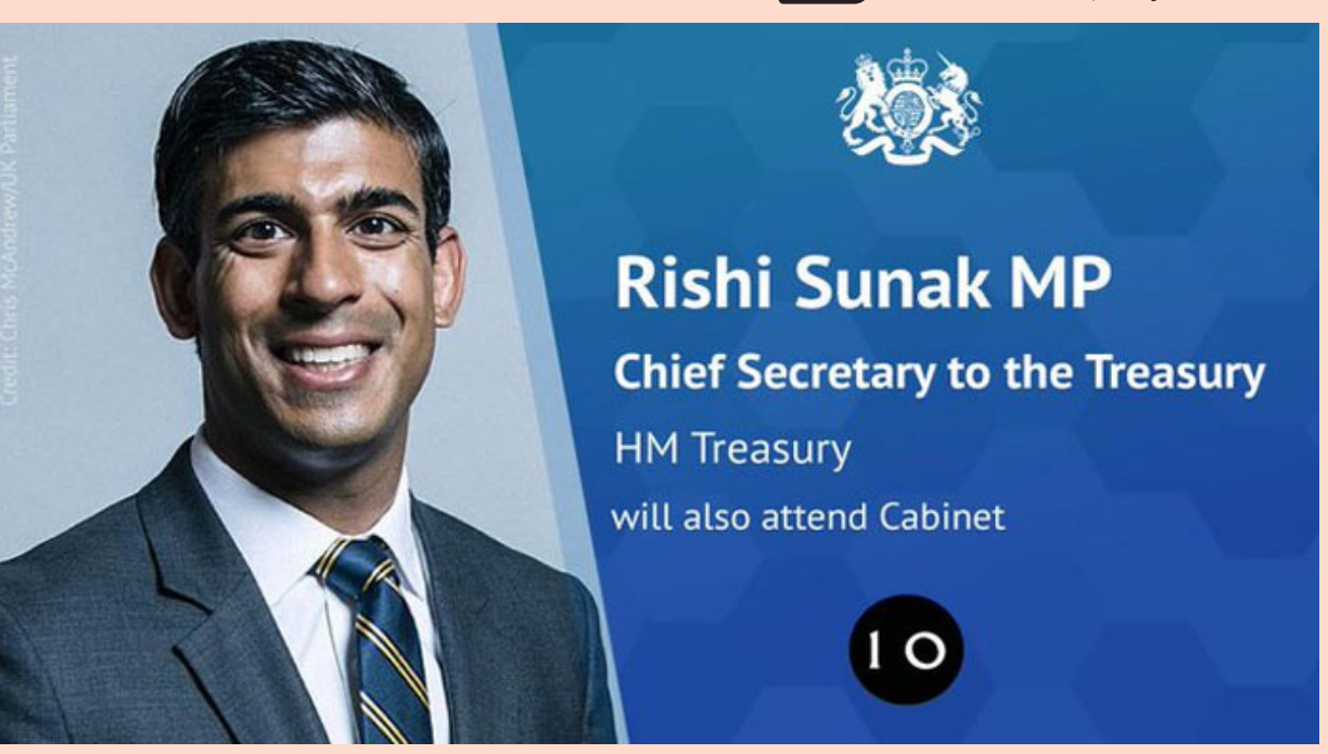
Rishi Sunak MP Chief Secretary to the Treasury HM Treasury will also attend Cabinet