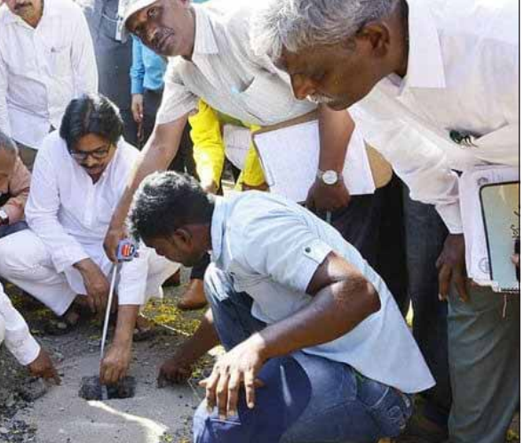
అయిన కృష్ణా జిల్లా కంకిపాడు మండలం గోడవర గ్రామంలో పర్యటిస్తున్న పవన్ కల్యాణ్, గోడవర గ్రామంలో నిర్మిస్తున్న బీటీ రోడ్డు పరిశీలన

అమరావతి, డిసెంబర్ 23: పవన్ కల్యాణ్ సీఎం పవన్ కల్యాణ్ గత కొన్ని రోజులుగా రాష్ట్రంలో క్షేత్రస్థాయి పర్యటనలు జరుపుతున్నారు. ఇవాళ