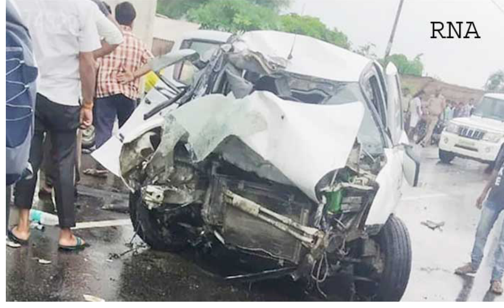
గద్వాల జిల్లాలో ట్రాక్టర్ను ఢీకొని ప్రమాదానికి గురయిన కారు

వేర్వేరు ప్రమాదాల్లో నలుగురు మృతి గద్వాల జిల్లాలో ముగ్గురు...ములుగులో ఒకరు మృతి హైదరాబాద్, జనవరి 22 (ఆర్ఎన్ఎస్): తెలంగాణ జిల్లాల్లో రోడ్డు నెతురోడాయి. వేర్వేరు ప్రమాదాల్లో కనీసం నలుగురు మృత్యువాత వడగా వలువురం క్షతగాత్రులయ్యారు. గద్వాల జిల్లాలో జరిగిన ప్రమాదంలో ముగ్గురు, ములుగు జిల్లా ప్రమాదంలో ఒకరు, నల్లగొండ జిల్లాలో జరిగిన మరో ప్రమాదంలో ఒకరు మరణించారు. గద్వాల జిల్లాలో ఆగి ఉన్న ఓ చెరుకు ట్రాక్టర్ను అతివేగంగా వచ్చిన ఓ కారు ఢీ కొట్టింది. ఈ ప్రమాదంలో ముగ్గురు వ్యక్తులు అక్కడికక్కడే మరణించారు. ఈ ప్రమాదం గద్వాల మండలం, దెయ్యాల వాగు వద్ద