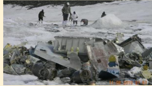
గాలింపు చేపట్టగా మరొక విమానం గుర్తించారు. ఈ క్రమంలో ఆది మృతదేహాలను గుర్తించారు. వారం విమానానికి సంబంధించి 2009 నుంచి ఈ గాలింపు చర్యలను నిలిపివేశారు. అయితే ఏరో ఇంజిన్, ఎలక్ట్రిక్ న గతేడాది జులైలో విమానానికి ర్యూట్స్, ఇంధన ట్యాంక్ యూ సంబంధించిన కొన్ని శకలాల నిల్వ, ఎయిర్ బ్రేక్ అసెంబ్లీ, కాక్ డాకా గ్నేషియల్ వడినట్లు పిట్ డోర్ తదితర భాగాలను గుర్తి వార్తలు వచ్చాయి. దీంతో ఆర్మీ, ఎంపిలు అధికారులు తెలిపారు.

తాజా గాలింపులో శకలాల లభ్యం ఎయిర్ ఫోర్స్ సంయుక్తంగా మరో సారి గాలింపు చర్యలను ముమ్మారు చేపట్టగా మరొక విమానం గల్లంతయిన విమానం గుర్తించారు. ఈ క్రమంలో ఆది మృతదేహాలను గుర్తించారు. వారం విమానానికి సంబంధించి 2009 నుంచి ఈ గాలింపు చర్యలను నిలిపివేశారు. అయితే ఏరో ఇంజిన్, ఎలక్ట్రిక్ న గతేడాది జులైలో విమానానికి ర్యూట్స్, ఇంధన ట్యాంక్ యూ సంబంధించిన కొన్ని శకలాల నిల్వ, ఎయిర్ బ్రేక్ అసెంబ్లీ, కాక్ డాకా గ్నేషియల్ వడినట్లు పిట్ డోర్ తదితర భాగాలను గుర్తి వార్తలు వచ్చాయి. దీంతో ఆర్మీ, ఎంపిలు అధికారులు తెలిపారు.