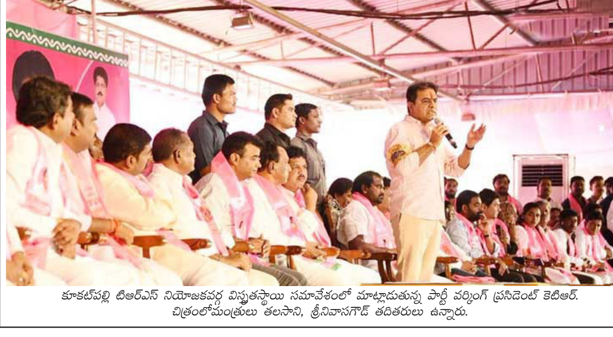
కూకట్పల్లి టీఆర్ఎస్ నియోజకవర్గ విస్తృతస్థాయి సమావేశంలో మాట్లాడుతున్న పార్టీ వర్కింగ్ ప్రెసిడెంట్ కేటీఆర్. చిత్రంలో మంత్రిలు తలసాని, శ్రీనివాస్ గౌడ్ తదితరులు ఉన్నారు.