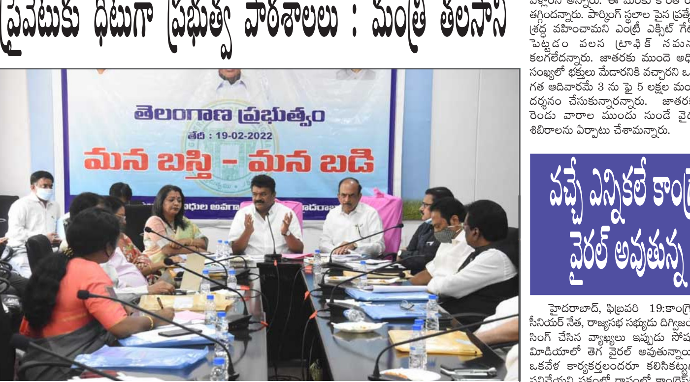
మీద: తెలంగాణ ప్రభుత్వం మున్ బస్తి - మన బడి

కొత్త వచ్చే విద్యార్థుల కోసం కేంద్రం ఆర్థికశాఖ మంత్రికి లేఖ రాశారు. గతంలో చేసిన అభ్యర్థనలను మరోసారి గుర్తు చేశారు. ఆంధ్రప్రదేశ్ పునరుద్ధక ప్రణాళి వల్ల గతంలోని 94 (2) ప్రకారం వెనుకబడిన ప్రాంతాల అభివృద్ధికి కేటాయించిన నిధుల్లో రెండేండ్ల బకాయి రూ.900 కోట్లు పెండింగ్ లో ఉన్నాయని, వాటిని విడుదల చేయడంతో పాటు గ్రాంట్లను 2021-22 తర్వాత బడ్జెట్ పాటు ప్రకటించాలని కోరారు. సీటి ఆయోగ్ నుంచి మేరకు రూ.24,205 కోట్లు ఇవ్వాలన్నారు.