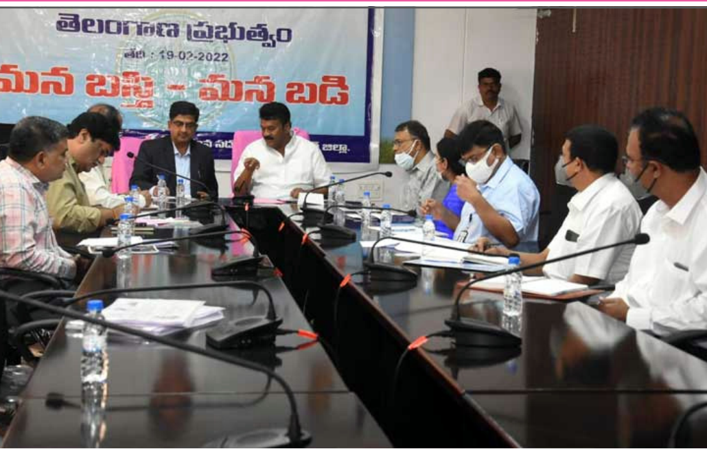
మీద: తెలంగాణ ప్రభుత్వం మున్ బస్తి - మన బడి

పై: మేదారం జాతర. కేంద్ర ఆర్థికశాఖ మంత్రి నిర్మలా సీతారామన్ కు రాష్ట్ర ఆర్థికశాఖ మంత్రి హరీశ్ రావు శనివారం మరోసారి లేఖ రాశారు. గతంలో చేసిన అభ్యర్థనలను మరోసారి గుర్తు చేశారు. ఆంధ్రప్రదేశ్ పునరుద్ధక ప్రణాళి వల్ల గతంలోని 94 (2) ప్రకారం వెనుకబడిన ప్రాంతాల అభివృద్ధికి కేటాయించిన నిధుల్లో రెండేండ్ల బకాయి రూ.900 కోట్లు పెండింగ్ లో ఉన్నాయని, వాటిని విడుదల చేయడంతో పాటు గ్రాంట్లను 2021-22 తర్వాత బడ్జెట్ పాటు ప్రకటించాలని కోరారు. సీటి ఆయోగ్ నుంచి మేరకు రూ.24,205 కోట్లు ఇవ్వాలన్నారు.