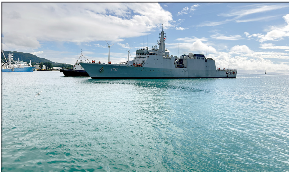
సెలెన్ లోని పోర్ట్ వికారియాకు చేరుకొన్న ఐఎన్ఎస్ సునయన. సెలెన్ లోని పోర్ట్ వికారియాకు చేరుకొన్న ఐఎన్ఎస్ సునయన.