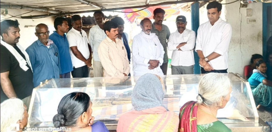
రాజన్న సిరిసిల్ల, జూన్ 18 (నేటిపాటి ప్రతినిధి): మంత్రి పొంగలేటి శ్రీనివాస రెడ్డి ఖమ్మం, పాతేరు నియోజకవర్గాల్లో బుధవారం పర్యటించనున్నారు. ఈ సందర్భంగా కలెక్టర్లను కలిసి ఆయా నియోజకవర్గాలను సందర్శించనున్నారు.