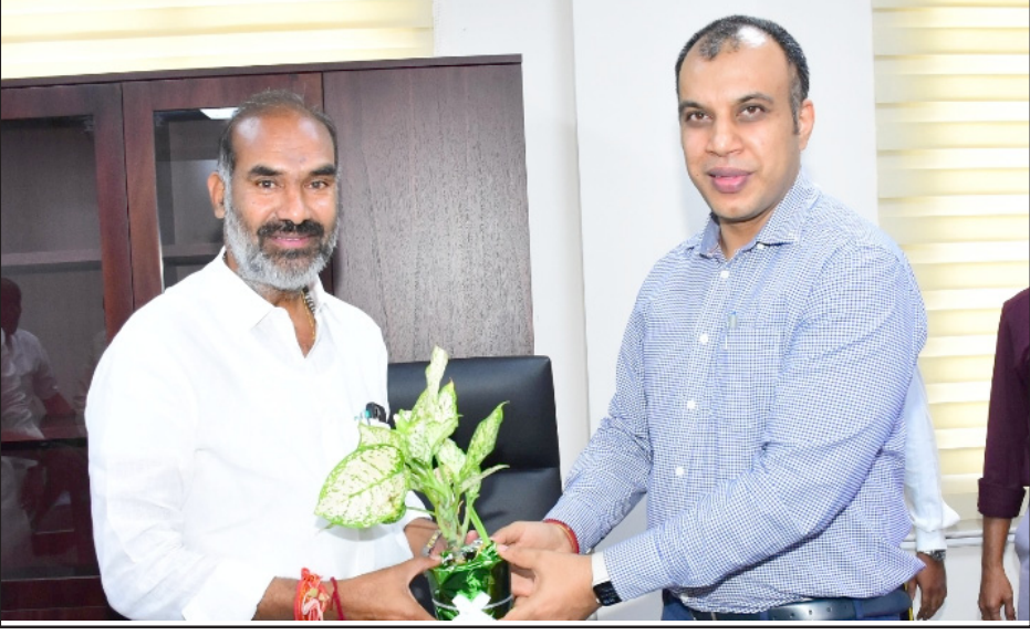
రాజన్న సిరిసిల్ల, జూన్ 18 (నేటిపాటి ప్రతినిధి): మంత్రి పొంగలేటి శ్రీనివాస రెడ్డి ఖమ్మం, పాతేరు నియోజకవర్గాల్లో బుధవారం పర్యటించనున్నారు. ఈ సందర్భంగా కలెక్టర్లను కలిసి ఆయా నియోజకవర్గాలను సందర్శించనున్నారు.