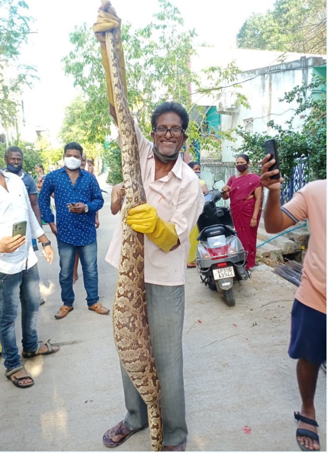
తిరుపతి,మే 18: తిరుపతి లోని జీవశాస్త్ర లోని లింగేశ్వర స్వామి ఆలయం వద్ద భారీ కొండచిలువ హల్ చల్ చేసింది. స్థానిక జీవశాస్త్ర వద్ద ఉన్న లింగేశ్వర గుడి ప్రాంతం వద్ద 12 అడుగుల కొండచిలువ కుక్క బిల్లును చంపి తర్వాత కూడా ఉంది. అది గమనించిన భక్తులు భయాందోళనకు గురైనారు. దీంతో ఖాస్కర్ నాయుడు వచ్చి చాక చక్కగా చట్టుకుని అటవీ ప్రాంతంలో పదిలిపెట్టారు.