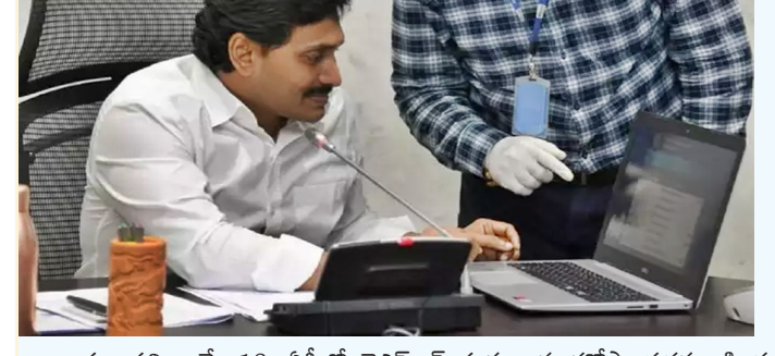
అమరావతి, మే 18: ఏపీలో వైఎస్ఆర్ మత్స్యకార భరోసా పథకం కింద లబ్ధిదారులకు చెల్లించడానికి రూ.119.88 కోట్లను విడుదల చేస్తూ రాష్ట్ర ప్రభుత్వం సోమవారం ఉత్తర్వులు జారీచేసింది. చేపల వేటను నిషేధించిన సమయంలో జీవనోపాధి కోల్పోయిన ఒక్కో మత్స్యకారులకు అందుబాటుగా ఏటా రూ.10 వేల ఆర్థిక సహాయం అందించే లక్ష్యంతో ప్రభుత్వం ఈ పథకాన్ని అమలు చేస్తోంది. మంగళవారం జరిగిన కార్యక్రమంలో సీఎం జగన్ నిధులను లబ్ధిదారుల ఖాతాల్లో జమ చేయమన్నారు.

ఏపీలో నేడు మరో పథకం.. ఒక్కొక్కరి ఖాతాల్లో రూ.10వేలు అమరావతి, మే 18: ఏపీలో వైఎస్ఆర్ మత్స్యకార భరోసా పథకం కింద లబ్ధిదారులకు చెల్లించడానికి రూ.119.88 కోట్లను విడుదల చేస్తూ రాష్ట్ర ప్రభుత్వం సోమవారం ఉత్తర్వులు జారీచేసింది. చేపల వేటను నిషేధించిన సమయంలో జీవనోపాధి కోల్పోయిన ఒక్కో మత్స్యకారులకు అందుబాటుగా ఏటా రూ.10 వేల ఆర్థిక సహాయం అందించే లక్ష్యంతో ప్రభుత్వం ఈ పథకాన్ని అమలు చేస్తోంది. మంగళవారం జరిగిన కార్యక్రమంలో సీఎం జగన్ నిధులను లబ్ధిదారుల ఖాతాల్లో జమ చేయమన్నారు. గతంలో రూ.4 వేల చొప్పున మాత్రమే ఇచ్చిన భృతి మొత్తాన్ని ఎన్నికల సందర్భంగా ఇచ్చిన హామీ మేరకు రాష్ట్ర ప్రభుత్వం రూ.10 వేలకు పెంచింది. రెండేళ్లగా ఏటా క్రమం తప్పకుండా వేట నిషేధ సమయంలోనే భృతిని అందజేస్తూ మత్స్యకారులకు అందుబాటుగా ప్రభుత్వం అందగా నిలుస్తోంది. ఈ విధంగా 2019లో 1,02,278 కుటుంబాలకు రూ.102.48 కోట్లు లబ్ధి చేశారూ, 2020లో 1,09,231 కుటుంబాలకు రూ. 109.23 కోట్ల మేర సాయమందించారు.