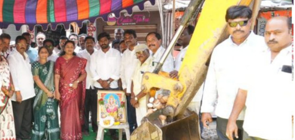
సుందర్ గామ పట్టణంలోని రైతుసేట ప్రాంత ప్రజల ఎదుర్కొంటున్న తాగునీటి సమస్యకు శాశ్వత పరిష్కారం దిశగా కీలక ముందరం పడింది. రూ.39 లక్షల 50 వేల వ్యయంతో చేపట్టనున్న కీసర పంపింగ్ మొదలు పనులకు తంిరగా సౌమ్య గురువారం కూటమి నాయకులతో కలిసి శంకుస్థాపన చేశారు. కొబ్బరి కాండ్ల వసతులను ప్రారంభించిన ఎమ్మెల్యే సౌమ్య, ప్రజలకు మెరుగైన తాగునీటి సౌకర్యాల కల్పించడం రాష్ట్ర ప్రభుత్వ ప్రధాన లక్ష్యమని స్పష్టం చేశారు. రైతుసేట ప్రాంతంలో చాలా కాలం కొనుగోలుతున్న నీటి సమస్యను దృష్టిలో ఉంచుకుని ప్రత్యేకం తంిరగా సౌమ్య గురువారం గా నిధులు మంజూరు చేయించినట్లు తెలిపారు. అభివృద్ధి పనులు నాణ్యత ప్రమాణాలతో, నిర్ణీత గడువులో పూర్తి చేయాలని సంబంధిత అధికారులకు ఆమె ఆదేశాలు జారీ చేశారు. తాగునీరు, డ్రైనేజీ, రూపొందించిన పంటి మౌలిక సదుపాయాల