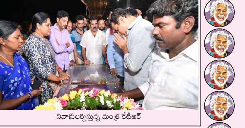
నివాళులర్పిస్తున్న మంత్రి కేటీఆర్

నిశ్చింత అగ్నికణంగా అది వేలాది గొంతులను రగిలించి ప్రశ్నించే తత్వాన్ని జీవింపజేసింది తన మాట తన పాట తన ఆట అమరమై పేదోడి గుడిసెలో -శ్రీపాల్ 8978894808