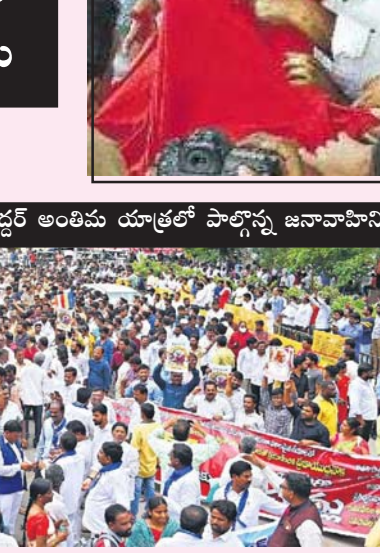
అమరవీరుల స్మృతం పచ్చ..