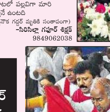
గద్దర్ ఇక లేడు

గళం ఎప్పుడూ గద్దరన్ననే ఉంటుంది గద్దర్ పాటగా పరామర్శిస్తూనే ఉంటుంది నీ నీడైనా గళం ప్రజల తోడైన గళం అభిమానుల గుండెలతో రాజుగా పాటను నిలిపినగళం. దప్పు డోలకు వచ్చుతుంటే అడవికి జతైన గళం ఆ పాటకు ప్రజల బాధ తెలుసు సముద్ర అలల శబ్దాలను గుండెలో దాచిన గళం. మండే బడ భాగ్ని గా పాటగా పోల్చిన గళం ఆ పాటకు కాల్ గజ్జెతో నాట్యమాడడం తెలుసు ఆ పాటకు ప్రజా చేతన సవ భావమవ్వడం తెలుసు. ఆ పాటలో వీరుడి పూహం పల్లవిగా మోగింది ఆ పాటలో చరిత్రకందని భావం