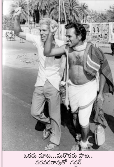
ఒకరు మాట... మరొకరు పాట... వరపరరావుతో గద్దర్