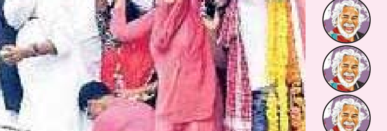
అతను వాక్కు అజరామరం

ప్రజా ఉద్యమ కెరటం గద్దర్ పల్లె పల్లెలో తన బుర్రకడలతో జనాలను జాగృతి పరుస్తూ అన్యాయాలను ఎదుర్కొన్నదానికి వేమన్నానంటూ తన గొంతు వినిపిస్తూ జననాట్యమండలి ద్వారా చైతన్యం లా ముందుకు సాగిన బలహీన వరాల బాబులూ.. గద్దర్ తెలంగాణ తొలి దళ ఉద్యమంలో సవయమతను చైతన్య పరిచిన దీప్తి పోరు బాటలో విడుతలా కడులుతూ ఉద్యమాన్ని ఉరక తెల్లించిన యోధ బుర్రకడల ద్వారా ప్రజలందరినీ మేలుకొలిపిన సామాజిక చైతన్యం తెలంగాణ స్వరాష్ట్రకాంక్ష ప్రతి మదిలో రగిలించిన ప్రజాగాయకుడు జనంపై జరిగే అక్కాళ్ళాలను చూసి తట్టుకోలేక ఎదిరించి పోరాడిన క్రియాశీలక శక్తి పొడుపున్న పొద్దు మిద నడుస్తున్న