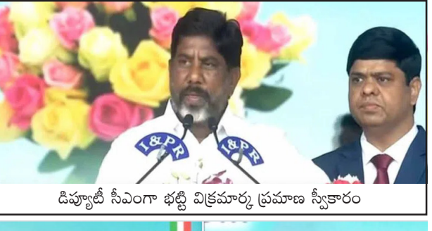
డిప్యూటీ సీఎంగా భట్టి విక్రమార్కు ప్రమాణ స్వీకారం