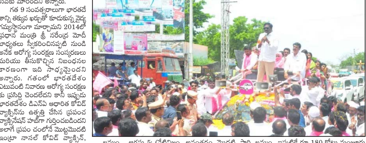
ఖమ్మం, ఆగస్టు 5: (నేటిదిం) ప్రజా రవాణా సౌకర్యాన్ని మరింత పటిష్టం చేయాలి.

కేంద్రీయ విద్యాలయాల ప్రవేశాల్లో ఎంపీ కోటా పునరుద్ధరించేది లేదు - స్పష్టం చేసిన కేంద్ర విద్యాశాఖ సహాయ మంత్రి అన్నపూర్ణ దేవి