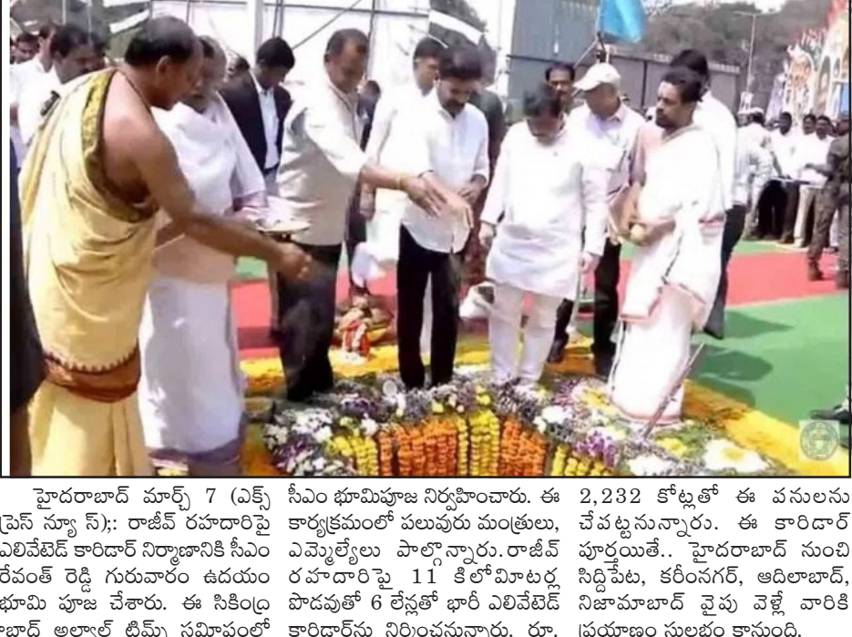
హైదరాబాద్ మార్చి 7 (ఎక్స్ ప్రెస్ స్కూప్): రాజీవ్ రహదారిపై ఎలివేటెడ్ కారిడార్ నిర్మాణానికి సీఎం రేవంత్ రెడ్డి గురువారం ఉదయం భూమి పూజ చేశారు. ఈ సందర్భంగా రాజీవ్ రహదారిపై 11 కిలోమీటర్ల పొడవుతో 6 లేన్లతో భారీ ఎలివేటెడ్ కారిడార్ను నిర్మించనున్నారు. రూ.