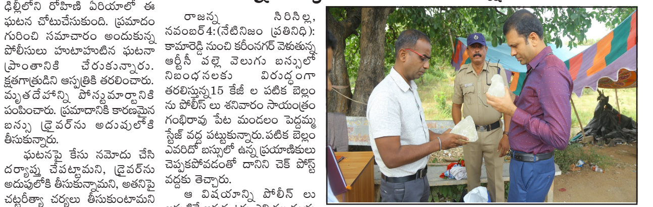
రాజన్న సిరిసిల్ల, నవంబర్ 4: (నేటినిజం ప్రతినీధి): కామారెడ్డి సుంచి కలెక్టరేట్ కేంద్రాన్ని ఆర్డీసీ వల్లె వెలుగు బస్సులో నిబంధనలకు విరుద్ధంగా తరలిస్తున్న 15 కేజీల పటిక బెల్లం ను పోలీస్ లు శనివారం సాయంత్రం గంధిపాపు పేట మండలం పెద్దమ్మ స్టేజ్ వద్ద పట్టుకున్నారు. పటిక బెల్లం ఎవరో బస్సులో ఉన్న ప్రయాణికులు చెప్పకపోవడంతో దానిని చెక్ పోస్ట్ వద్దకు తెచ్చారు. ఆ విషయాన్ని పోలీస్ లు అప్పటికే అక్కడ ఉన్న ఎన్నికల వ్యయ పరిశీలకులు, మజిలీ గంధిపాపు

- పెద్దమ్మ స్టేజ్ చెక్ పోస్ట్ వద్ద పట్టుకున్న పోలీస్ లు ఎన్నికల వ్యయ పరిశీలకుల సమక్షంలో సీజ్