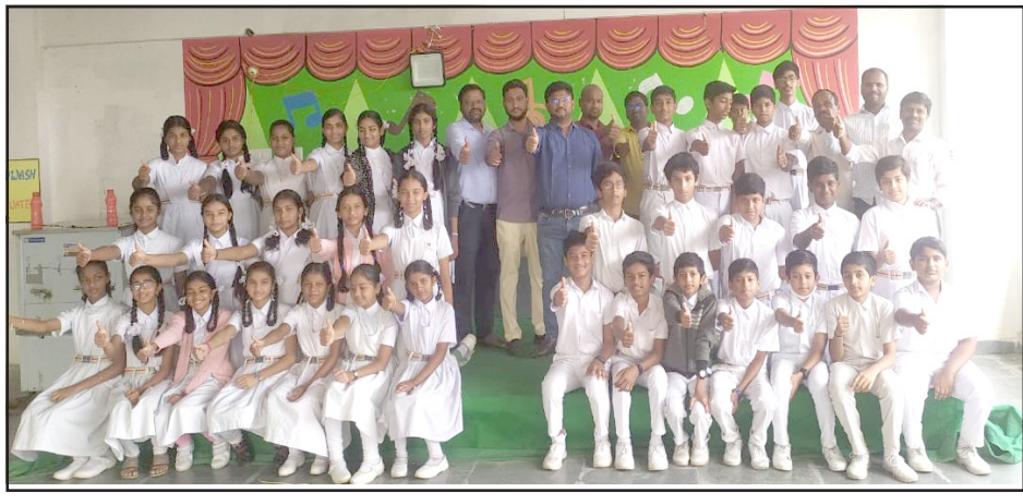
రాజన్న సిరిసిల్ల, నవంబర్ 4: (నేటినిజం ప్రతినీధి): సిరిసిల్ల పట్టణం లోని శ్రీ చైతన్య స్కూల్ విద్యార్థులు క్యాట్ మొదటి విభాగం ఫలితాల్లో 59 మంది విద్యార్థులు ఎంపిక చేసే పాట క్యాట్ 2 విభాగం