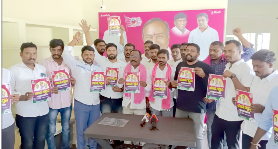
రాజన్న సిరిసిల్ల, నవంబర్ 4: (నేటినిజం ప్రతినీధి): బిఆర్ఎస్ పార్టీ విద్యార్థి, యువజన విభాగం అధ్యక్షులతో కనెల 6వ పట్టణంలో నిర్వహించిన యువ గర్వన సమీక్షను నియోజకవర్గంలోని విద్యార్థులు, యువకులు పెద్ద ఎత్తున హాజరై విజయవంతం చేయాలని బిఆర్ఎస్ పార్టీ యువజన విభాగం నాయకులు పిలుపునిచ్చారు. ఈ సేవకు

- బిఆర్ఎస్ పార్టీ యువజన విభాగం నాయకుల పిలుపు