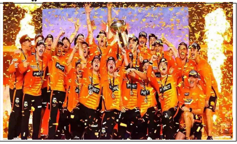
న్యూఢిల్లీ, ఫిబ్రవరి 4: ఆస్ట్రేలియాలో జరిగిన బిగ్బాష్ లీగ్లో పెర్ స్పార్సర్స్ విజేతగా నిలిచింది. ఫైనల్లో బ్రిస్బేన్ హీట్పై 5 వికెట్ల తేడాతో గెలుపొందింది. డాంట్, బాల్సారి బిగ్బాష్ లీగ్ ట్రోఫీ నెగ్గు జట్టుగా రికార్డు క్రియేట్ చేసింది. జిమ్మీ వియర్స్ నాయకత్వంలోని బ్రిస్బేన్ హీట్ ఫైనల్లో తొలుత బ్యాటింగ్ చేసింది. ఆ జట్టు సగిల్ ఓపెనర్లలో 7 వికెట్ల నష్టానికి 175 రన్స్ చేసింది.

బ్రిస్బేన్ హీట్ ఇన్ఫాంటో మిడిలాడ్లర్ బ్యాటర్ నాథన్ మెక్స్వేన్ (41) టాప్ స్కోరర్. 176 బంబుల్ చేసిన పెర్ స్పార్సర్స్ అటూడు అప్సర్ టర్నర్ హాఫ్ సెంచరీ (51)తో రాజీయాడు. వివేక కూపర్ 11 బంబుల్లో 25 రన్స్ చేయడంతో ఆ జట్టు 19.2 ఓపెనర్లతోనే లక్ష్యాన్ని చేరింది. పెర్ స్పార్సర్స్ జట్టు 2014, 2015, 2017, 2022లో బిగ్బాష్ లీగ్ ఛాంపియన్గా అవతరించింది.