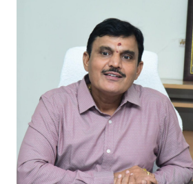
జిల్లా కలెక్టర్ దాక్టర్ శరత్.

-జిల్లాలో 69 బృందాలతో కంటి పరీక్షలు నిర్వహణ . -ఇప్పటి వరకు 1,59,053 మందికి కంటి పరీక్షలు పూర్తి. హైదరాబాద్, ఫిబ్రవరి 4: కంటి వెలుగు కార్యక్రమములో 18 సంవత్సరాల పైబడిన వారందరూ కంటి పరీక్షలు చేయించుకోవాలన్నారు. జిల్లాలో 18 సంవత్సరాల పైబడిన 17,11,685 మందికి కంటి పరీక్షలు నిర్వహణ లక్ష్యంగా 69 బృందాలతో జనవరి 19 నుండి సోమవారం నుండి శుక్రవారం వరకు ప్రభుత్వ సెలవు దినాలు మినహా ప్రతిరోజూ ఉదయం 9 గంటల నుండి సాయంత్రం నాలుగు గంటల వరకు కంటి వెలుగు శిబిరాలలో పరీక్షలు నిర్వహిస్తున్నారన్నారు. కంటి వెలుగు రెండో విడత లో భాగంగా ఇప్పటి వరకు (ఫిబ్రవరి, 3 నాటికి) జిల్లాలో