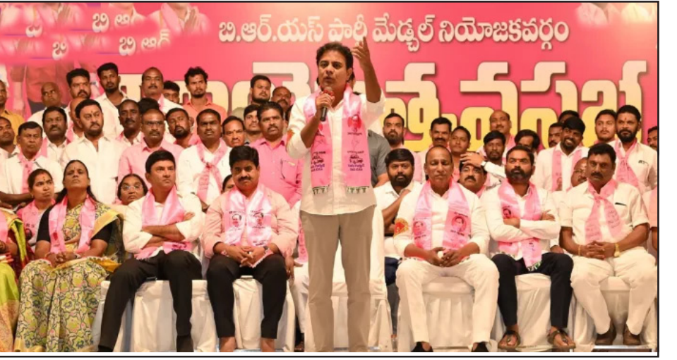
బి.ఆర్.యస్.పార్టీ మేధుల్ నియోజకవర్గం సమావేశం దృశ్యం

- 50 రోజుల్లోనే జనాల్లో అసంతృప్తి - మహిళల మధ్య కొట్లాటలు - ఆటోలు తగలదు అంటున్న డ్రైవర్లు - 420 హోమియల్ సెంటర్లుగా... - మాదు అదుగులు లేని వృత్తి అంటూ సీరియస్.. - కేసీఆర్పై వ్యాఖ్యలపై కేటీఆర్ కాంటర్.. మేధుల్ అసెంబ్లీ నేతలతో సమాక్ష