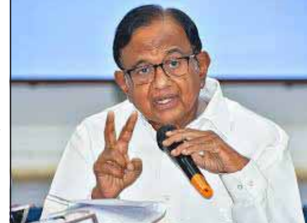
ఫండింగ్లో పారదర్శకత కోసం 2018లో తొలి సారి ఎలక్షోరల్ బాండ్లను జారీ చేయడం చట్టపరమైన లంచం అని కాంగ్రెస్ నేత చిదంబరం ఆరోపించారు.

అక్టోబర్ 30 (ఎక్స్ ప్రెస్ న్యూస్) ఎలక్షోరల్ బాండ్లను జారీ చేయడం చట్టపరమైన లంచం అని కాంగ్రెస్ నేత చిదంబరం ఆరోపించారు. అక్టోబర్ 4వ తేదీ నుంచి పది రోజుల పాటు ఎలక్షోరల్ బాండ్లను ఓపెన్ చేస్తున్నట్లు ఇటీవల కేంద్ర ప్రభుత్వం ప్రకటించిన విషయం తెలిసింది. ఈ నేపథ్యంలో కాంగ్రెస్ నేత చిదంబరం ఆ ఆరోపణలు చేశారు. బీజేపీ సర్కారుకు ఇది బంగారు పంటగా మారుతుందని ఆయన విమర్శించారు. 28వ సారి ఎలక్షోరల్ బాండ్లను అనుమతి ఇస్తూ కేంద్ర సర్కారు శుభవార్తను ప్రకటించి జారీ చేసింది. స్టేట్ బ్యాంక్ ఆఫ్ ఇండియాకు చెందిన అన్ని క్రాంతిలలో అక్టోబర్ 4 నుంచి 13వ వరకు 28వ విడత ఎలక్షోరల్ బాండ్లను విక్రయం చేసేందుకు చట్టపరమైన లంచం ఉన్నట్లు కేంద్ర ప్రభుత్వం తెలిపింది. డా॥ జలల్ మహమూద్ రెడ్డి, చట్టపరమైన లంచం, గాణ, మిజోరం రాష్ట్రాల్లో త్వరలో అసెంబ్లీ ఎన్నికలు జరగనున్నాయి. ఈ నేపథ్యంలో కేంద్రం ఎలక్షోరల్ బాండ్లను విక్రయించనన్నట్లు తెలిపింది. గత రికార్డులను దృష్టిలో పెట్టుకుంటే, ఆ బాండ్లలో 90 శాతం వరకు బీజేపీకి వెళ్లనున్నట్లు కాంగ్రెస్ నేత చిదంబరం ఆరోపించారు. ఆశ్రిత పెట్టుబడిదారులు తమ చెక్ బుక్ లను ఓపెన్ చేసి డిజిటీల్డ్ ఉన్న తమ పాస్టర్లకు సంబంధించి కేంద్రం చేస్తోన్న ఓపెన్ బ్యాంక్ లో అయిన వివిధ బ్యాంకులలో గా అయిన వివిధ బ్యాంకులలో