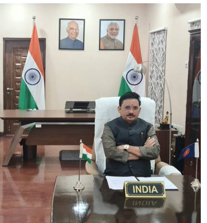
(బఠి), 5జి, అడ్వాన్స్డ్ సాటిలైట్ కమ్యూనికేషన్, సైబర్ సెక్యూరిటీ తదితరాలు సహా సమాచార, కమ్యూనికేషన్ సాంకేతికతలు క్షేత్రం సహా ఉద్ఘాటించారు. రంగాలలో జ్ఞాన మార్పిడి వంటి అంశాలు ఉన్నాయి. ప్రస్తుతం సమావేశం ఒకరి బలాలను మరొకరు పరిపూర్ణం చేస్తూ ప్రతిపాదిత బనీటీ ప్రాజెక్టులు భారత్, అసియన్ మధ్య సహకారాన్ని బలోపేతం చేస్తాయి.

డిజిటల్ మంత్రుల సమావేశాన్ని ఉద్దేశించి మాట్లాడుతూ, సమాచార, కమ్యూనికేషన్ సాంకేతికతలు ప్రజలు, ప్రభుత్వానికి మద్దతు పెరిగిన సంప్రదింపులను పెంచి ప్రజాస్వామిక వ్యవస్థలను, సంస్థలను బలోపేతం చేసేందుకు తోడ్పడతాయని దేవుస్ సెన్ చౌహాన్ ఉద్ఘాటించారు. బనీటీలు వాక్ సాక్షాత్కారాన్ని మానవ హక్కులను, సమాచారం అలభ్యతలు లేకుండా ప్రసారం కావడాన్ని ప్రోత్సహించడమే కాక నిర్ణయాలు చేసే ప్రక్రియలో పాల్గొనేందుకు పౌరుల అవకాశాలను విస్తరించి, గ్రామాణ ప్రాంతాలలో జీవించే ప్రజల జీవితాలను పరివర్తనకు లోను చేయగల సంభావ్యతను కలిగి ఉంటుందని ఆయన పేర్కొన్నారు. దేశ అభివృద్ధికి వివిధ సాంకేతిక పరిష్కారాలను వినియోగించుకోవాలన్న ప్రధానమంత్రి సరేంద్ర్ మోడి ద్వారానికేతను మంత్రి గుర్తు చేసుకున్నారు. కోవిడ్-29 కేవలం ప్రజా ఆరోగ్య వ్యవస్థకు మాత్రమే సహాయ కాదని, అది దేశం ఆర్థిక, సామాజిక వ్యవస్థలను కుదిపేస్తోందని డి. దేవుస్ సెన్ చౌహాన్ తన ప్రసంగంలో అభిప్రాయపడ్డారు. ఈ పరిస్థితుల్లో సమాచార, కమ్యూనికేషన్ సాంకేతికతలు (ఐసీఐటీ) ప్రజా జీవితంలోని వివిధ రంగాలలో మహమ్మారి ప్రభావాలను నిర్మూలించేందుకు బలమైన పరికరాలుగా ఉద్ఘాటించారు. అవే అంతర్జాతీయ ఆర్థిక వ్యవస్థకు పునాదులు కూడానని అన్నారు. మంత్రుల సమావేశం ఇండియా- ఆసియన్ డిజిటల్ వర్క్ షాప్ 2022ను ఆమోదించింది. ఈ కార్యక్రమ ప్రణాళికలో దొంగలించిన, సకలి మొత్తం హోండ్ సెట్లు, దేశవ్యాప్త బహిరంగ ఇంటర్నెట్ వైబ్ ఆక్సెస్ నెట్ వర్క్, ఇంటర్నెట్ అఫ్ థింగ్స్