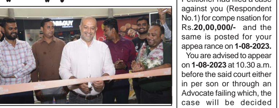
హైదరాబాద్, జూలై 27: భారతదేశంలోని ప్రముఖ క్రాజ్ పబ్లికేషన్స్ లో ఒకటైన భార్యకూ నేషన్ 'లైవ్-ఆన్-ది-బీటెన్' గ్రేడ్ కాన్సల్టెడ్ మార్కెట్ అయిన భార్యకూ శుక్రవారం ఉప్పల్లోని డిఎస్ఎల్ మార్కెట్ కోర్ట్ అవుట్లెట్ను ప్రారంభించింది. 4956 చదరపు అడుగుల విస్తీర్ణంలో శక్తివంతమైన, అధునాతన ఇంటిరియర్లతో ప్రారంభించారు. ఈ సందర్భంగా భార్యకూ నేషన్ హోటల్ లో టిఎస్ఎస్ టీఎస్ఎస్ టీఎస్ఎస్ ముఖ్యమంత్రి మాట్లాడుతూ భార్యకూ నేషన్లోని ఈ-ఆల్-యూ-కెన్ బిఫే ఆకాహారం, మానాసాహారం గ్రూప్ లో అనేక రకాల పంటకాలను అందిస్తుందన్నారు. స్టార్టర్ కోసం, మానాసాహారం తనా మటన్, గుడ్డా మసాలా, పెరి-పెరి గ్రేడ్ చికెన్, హాట్ గాల్లిక్ గ్రేడ్ రొయ్యలు, తందూరి టాంగ్లీ, మటన్ నీక్ కబాబ్, కోస్ట్ బార్బక్యూ ఫిష్ పంటి మటన్ రుచిరమైన పంటకాలు కలవన్నారు. బాబ్, కార్న్ ఆన్ కబాబ్, హాట్ సెన్మ్ సిస్టమెన్ పైసాబిల్, ఇతర వాటిలో మాంసాహారం కోసం ప్రధాన కోర్సు షిగాగంట్ చికెన్ దమ్ బియాన్, మటన్ రోగన్ జోష్, బటర్ చికెన్ మసాలా ఉన్నాయిన్నారు. శాశాహారం బనీర్ బటర్ మసాలా, మేథీ మటన్ మల్లె, డాల్-ఈ-డమ్, వెజ్ దమ్ బియాన్లను తినవచ్చని తెలిపారు. లైవ్ కౌంటర్లు మటన్ చాప్, భూనా తనా మటన్, చాక్లెట్ ఫూర్, కీమా పావ్, చికెన్ నీక్ పంటి వివిధ రకాల నాన్-వెజ్/వెజ్ కలవన్నారు. డెజర్ట్ విభాగంలో చాక్లెట్ ప్రోస్, రెడ్ వెల్వెట్ షెల్లీలు, అంగూరి గులాబ్ ఉమావన్, కేసర్ ఫిస్టీ మరెన్ని ఉన్నాయిన్నారు. కుల్లీలు ఎంతో రుచిరంగా ఉంటాయిన్నారు.