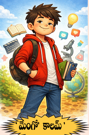
'మేం గో కాలమ్'

ఈ విషయం మీద అన్న, విదూ, ఇంకా మా బృందం సీరియస్ గా చర్చలు జరిపింది. ఇప్పుడు లోకంలో అందరూ ప్రవచనాలు చెప్పటానికి బాగా అలవాటుపడ్డారు. ఎదరటివారికి చెప్పేందుకే నీతులు వున్నాయి అనే విషయంలో ఎవరికీ అభ్యంతరం లేదు. ఏ ప్రవచనం ఎన్ని డబ్బులు తీసుకువస్తుంది. ఎంత కీర్తిని తీసుకువస్తుంది. ఇవన్నీ వస్తున్నప్పుడు సిగ్గు, శరమా మనకిలా! ఆ విషయాల్లో సైలెంట్ గా వుండటమే బతుకుతున్నవారు కొనసాగించే అద్భుతమైన కళ. కళ అంటే ప్రాక్టీస్ వుండాలి కదా. అందుకే ఇన్నిరకాల విన్నాసాలు అనుకున్నాం.