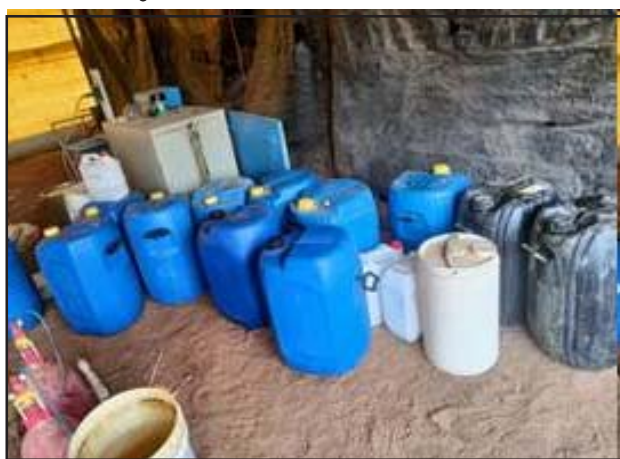
న్యూఢిల్లీ, మే25: డిఆర్ఐ కేంద్రం ద్వారా తెలంగాణలోని నాగర్ కర్నూల్ జిల్లాలో రహస్య తాత్కాలిక ప్రయోగశాలను గుర్తించింది.