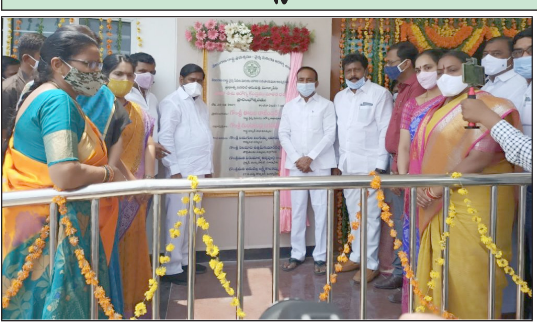
నల్లగొండ, ఏప్రిల్ 20: సూర్యాపేటలో మాతా శిశు సంరక్షణ కేంద్రాన్ని రాష్ట్ర వైద్యారోగ్య శాఖ మంత్రి ఈటల రాజేందర్, విద్యుత్ శాఖ మంత్రి జగదీశ్ రెడ్డి కలిసి ప్రారంభించారు. రూ. 17 కోట్లతో 250 పడకలతో

మాతాశిశు సంరక్షణ కేంద్రాన్ని నిర్మించారు. ఈ సందర్భంగా మంత్రి ఈటల రాజేందర్ మాట్లాడుతూ.. కొవిడ్ చికిత్సకు ప్రభుత్వం పూర్తిస్థాయిలో సిద్ధంగా ఉందని స్పష్టం చేశారు. కరోనా రోగులకు రాష్ట్రంలో ఆక్సిజన్ కొరత లేదని తెల్పి చెప్పారు. ఆస్పత్రుల్లో పడకలు దొరకడం లేదన్న పుకార్లు సమృద్ధి అని విజ్ఞప్తి చేశారు. ప్రజలు భయభ్రాంతులకు గురి కావద్దు అని సూచించారు. కొవిడ్ రోగుల్లో 5 శాతం మందిలోనే అనారోగ్య సమస్యలు వస్తున్నాయని తెలిపారు. 99.5 శాతం మంది రికవరీ అవుతున్నారని పేర్కొన్నారు. ప్రతి ఆరోగ్య కేంద్రంలో కొవిడ్ బెడ్లు పరికరాలు అందుబాటులో ఉన్నాయని చెప్పారు. ఇతర రాష్ట్రాలతో పోలిస్తే కొవిడ్ రోగులకు తెలంగాణ మెరుగైన సేవలందిస్తోంది అని ఈటల రాజేందర్ స్పష్టం చేశారు.