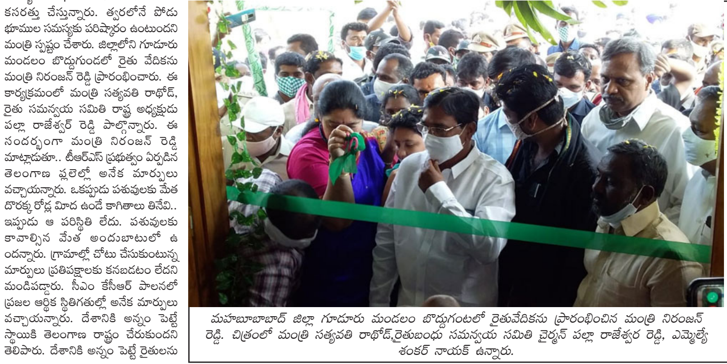
మహబూబాబాద్ జిల్లా గూడూరు మండలం బొడ్డుగంటలో రైతువేదికను ప్రారంభించిన మంత్రి నిరంజన్ రెడ్డి. చిత్రంలో మంత్రి సత్యవతి రాధాకృష్ణారెడ్డి, రైతులకు సమస్యలను సమీక్షించేందుకు వైకేం సేవలను ప్రారంభించిన మంత్రి నిరంజన్ రెడ్డి, చిత్రంలో మంత్రి సత్యవతి రాధాకృష్ణారెడ్డి, రైతులకు సమస్యలను సమీక్షించేందుకు వైకేం సేవలను ప్రారంభించిన మంత్రి నిరంజన్ రెడ్డి.

సమస్యలను సిఎం కెసిఆర్ పరిశీలిస్తున్నారు వెల్లడించిన మంత్రి నిరంజన్ రెడ్డి