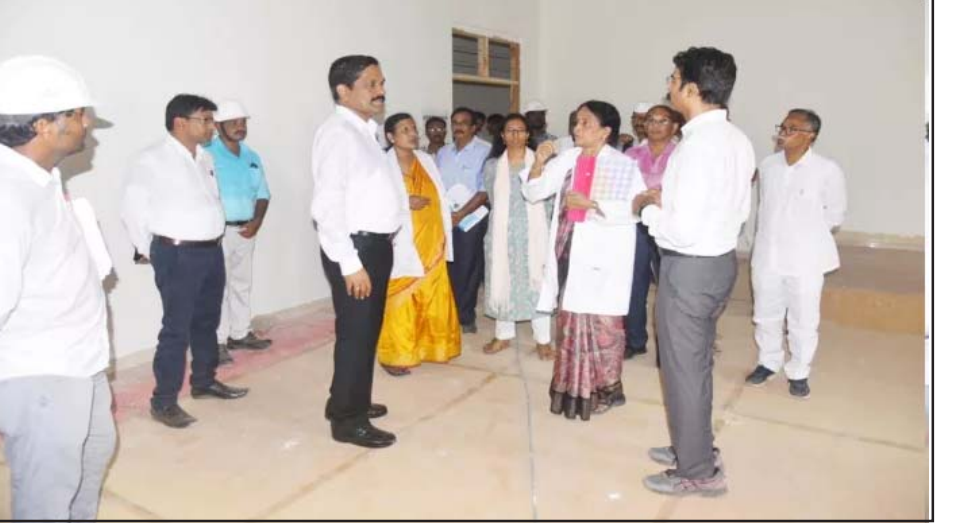
విజయనగరం, జూన్ 9: జిల్లా కళాశాలల్లో కలసి రాష్ట్రానికి ఈ కేంద్రంలో నిర్మాణంలో ఉన్న ప్రభుత్వ వైద్య కళాశాల పనులను జిల్లా వైద్య కేటాయింపు జరిగిందన్నారు. ఈ ఆర్గ్య శాఖ ప్రత్యేక ప్రధాన కార్యదర్శి ఆగష్టు నుంచే ఈ కళాశాలలు ప్రారంభం కానున్నట్లు తెలిపారు. ప్రారంభం కానున్నట్లు తెలిపారు. ప్రారంభం కానున్నట్లు తెలిపారు. ప్రారంభం కానున్నట్లు తెలిపారు.