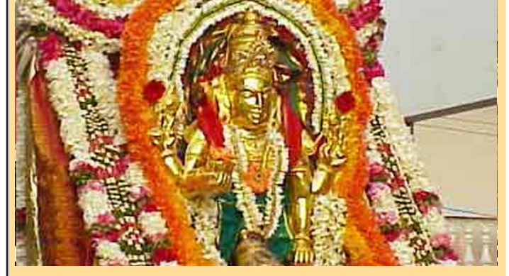
రాజన్న సిరిసిల్ల, జూన్ 8 (నేటికణం ప్రతినిధి): వేములవాడలోని శ్రీ రాజరాజేశ్వర స్వామి ఆలయం భక్తుల దర్శనాల నిమిత్తం సోమవారం తిరిగి తెరుచుకుంది. కరోనా మహమ్మారి కారణంగా విధించిన లాక్డౌన్ నేపథ్యంలో గడిచిన 80 రోజులుగా ఆలయంలోకి భక్తుల అనుమతిని నిరాకరించారు. ప్రభుత్వ ఆదేశాలతో రాష్ట్రవ్యాప్త ఆలయాల భక్తుల దర్శనానికి తెరుచుకున్నాయి. శ్రీ రాజరాజేశ్వర స్వామి ఆలయం ఈ తెల్లవారుజామున 4 గంటలకు తెరిచిన అనంతరం ఆలయ పూజారులు చేపడుతోన్న భక్తులతో స్వామివారికి సుప్రభాత సేవ నిర్వహించారు. అదేవిధంగా స్వామి శివుడికి ప్రాతకాల పూజను నిర్వహించారు. ఉదయం 6 గంటల తర్వాత ఆలయంలో భక్తులను అనుమతించారు. భక్తులకు భర్తల్లో స్ట్రోనింగ్ నిర్వహించి శానిటైజేషన్ లిఫ్ట్ల ద్వారా శానిటైజేషన్ చేసి అనంతరం స్వామి దర్శనానికి అనుమతిస్తున్నారు. గంటకు 200 మంది భక్తులను మాత్రమే ఆలయంలోకి వదులుతున్నారు. 65 ఎండ్లకు చైబెట్ వారిని, గర్భులను, పిల్లలకు దర్శనానికి అనుమతి లేదు.