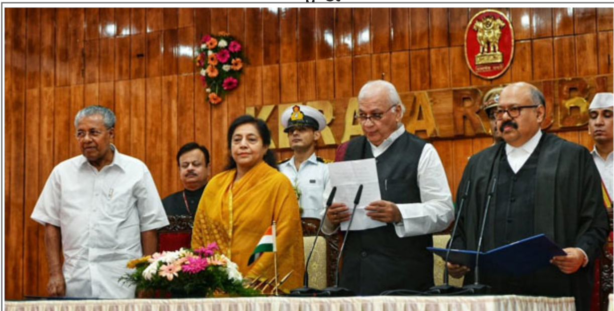
కేరళ గవర్నర్ గా ప్రమాణం చేసిన మహర్షి అరిఫ్ ఖాన్. చిత్రంలో సీఎం పినరయి కూడా ఉన్నారు.

- ప్రమాణం చేయించిన హైకోర్టు ప్రధాన న్యాయమూర్తి - పాల్గొన్న కేరళ సీఎం, మంత్రులు