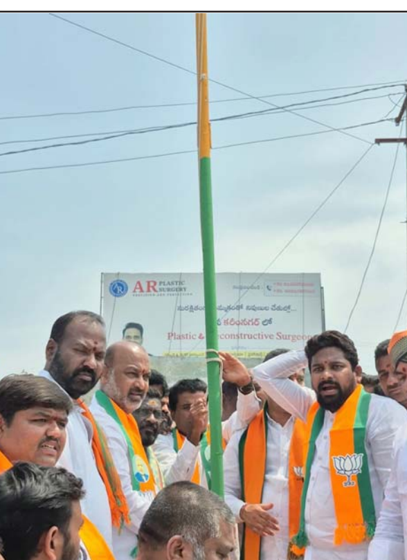
కరీంనగర్, ఏప్రిల్ 6:(నేటినిజం ప్రతినిధి) గన్నేరువరం మండలం గుండ్లపల్లి స్టేజ్ వద్ద సోమవారం రోజున బిజెపి జెండా గడ్డను కేంద్ర మంత్రి బండి సంజయ్ ఆవిష్కరించారు. భారతీయ