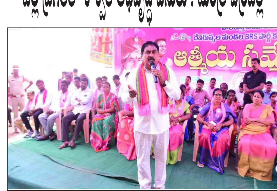
జనగాం, ఏప్రిల్ 4: పల్లె ప్రగతి కార్యక్రమాల ద్వారా పల్లెల్లో శాశ్వతంగా అభివృద్ధి పనులు చేశామని రాష్ట్ర పంచాయతీరాజ్, గ్రామాభివృద్ధి మంత్రి ఎర్రబెల్లి దయాకర్ రావు అన్నారు. జనగాం జిల్లా దేవరపల్లి మండలం చిన్న మదురలో, దేవరపల్లి గ్రామంలో మంగళ వారం జరిగిన బీఆర్ఎస్ పార్టీ ఆర్యవేదిక సమన్వయంతో ఆయన పాల్గొని మాట్లాడారు.

ఈ సందర్భంగా ముఖ్యమంత్రి, బీఆర్ఎస్ పార్టీ అధ్యక్షులు కేసీఆర్ సందేశాన్ని ఆర్యవేదిక సమన్వయంతో చేరి వినిపించారు. ఆయన మాట్లాడుతూ రాష్ట్రంలో కొత్త పంచాయతీరాజ్ చట్టం రావడంతోపాటు, 3,146 గూడాలూ, తండాలు కొత్తగా గ్రామ