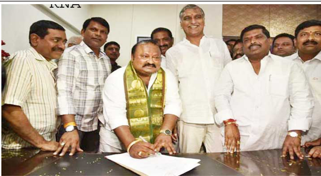
ఖైరతాబాద్ బీసీ కమిషన్ భవన్లో బాధ్యతలు స్వీకరించిన మంత్రి గంగుల కమలాకర్. చిత్రంలో మంత్రి హరీష్ రావు తదితరులు ఉన్నారు.

హైదరాబాద్, అక్టోబర్ 3 (ఆర్ఎన్ఎ): ఖైరతాబాద్లోని బీసీ కమిషన్ కార్యాలయంలో పౌర బాధ్యతలు స్వీకరించిన మంత్రి గంగుల కమలాకర్ అభినందించిన మంత్రి హరీష్ రావు కోరుతున్నామని హరీష్ రావు పేర్కొన్నారు. ఈ సందర్భంగా ఆయన మాట్లాడుతూ ఆంధ్రా