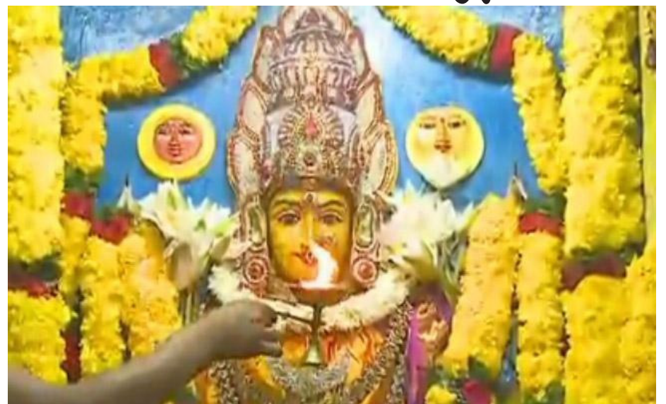
గాయత్రీదేవిగా అవతరించిన దుర్గమ్మ దర్శనాల కోసం భారతీయ తీరిన భక్తులు