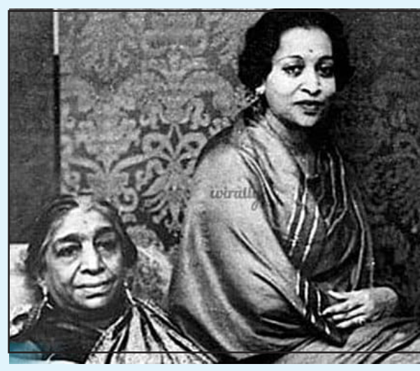
సందేశాన్ని విస్తృతంగా వ్యాప్తి చేసేందుకు, విదేశీ వస్తువులను బహిష్కరించడానికి కృషి సల్పారు. పద్మజా నాయుడు భారత రాజ్యంగ సభకు 1950 లో ఎన్నికై రెండేళ్ళు ఆ పదవిలో కొనసాగారు. ఆ తరువాత ఆమె 1956 నుండి 1967 వరకు పశ్చిమ బెంగాల్ గవర్నరుగా పనిచేశారు. స్వాతంత్ర్యోద్యమంలో చురుకుగా తల్లితో పాటు

1942లో జరిగిన క్వీట్ ఇండియా ఉద్యమంలో పాల్గొని జైలుకు వెళ్ళారు. అప్పటికి మహిళలకు ప్రత్యేకమైన జైళ్ళు లేకపోవడం, పలుకుబడి కలిగిన కుటుంబానికి చెందిన వారు కావడం మూలాల ఆమెను హౌస్ లోన్ లోని బేగం గారి దేవిడిలో నకల సౌకర్యాలు కలిగిన రాజభవనంలో నిర్బంధించారు. దానికి ఆమె సంతోషించక తనతో పాటు అరెస్టు అయిన తక్కిన మహిళలకు ఎందుకు ఆ పనులు కల్పించలేదని ప్రశ్నించారు. చైనా యుద్ధ సమయంలో ఆమె తనకున్న విలువైన బంగారు ఆభరణాలను నేషనల్ డిఫెన్స్ ఫౌండేషన్ కు సమర్పించారు. భారతదేశం నుండి "క్రమబద్ధమైన బ్రిటీష్ ఉపసంహరణ" కోరుతూ మహాత్మా గాంధీ ప్రారంభించిన క్వీట్ ఇండియా ఉద్యమంలో పాల్గొన్నారు. ఖాడి గురించి గాంధీ