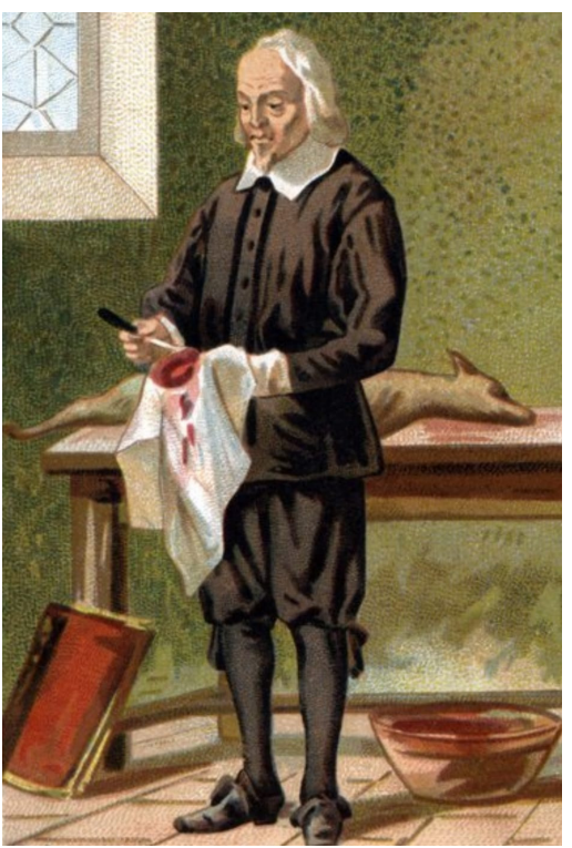
ఏప్రిల్ 1...విలియం హార్వే జయంతి

అని భావించే వారు. విలియం హార్వే ఇంగ్లండులోని ఫోక్స్ కిట్టోన్ లో 1578 ఏప్రిల్ 1న సంపన్నుడైన పట్టణ మేయరుకు పదిమంది సంతానంలో ఒకడిగా పుట్టాడు. వదిహేసవ వేటక కేంద్రాల్లోని సైన్స్ కాలేజీలో చేరాడు. పట్టణద్రుడయ్యాడు. ఆపై వైద్య విద్య కోసం ఇటలీలోని పాడువా వైద్య విద్యాలయంలో చేరాడు. అక్కడ హాలీనిమన్ ఫాబ్రీనియస్ అనే ప్రముఖ వైద్య శాస్త్రజ్ఞుని వద్ద శిష్యుడిగా చేశాడు. 1602 లో వైద్య శాస్త్రంలో పట్టా పుచ్చు కొనటమే కాకుండా ప్రత్యేకమైన యోగ్యతా పత్రాన్ని పొంద గలిగాడు. అక్కడి నుంచి లండన్ తిరిగి వచ్చాక ఇంగ్లండ్ రాజు మొదటి ఛార్లెస్ కొలువులో ఆస్ట్రాన్ వైద్యుడిగా నియమితుడయ్యాడు. అంతటే జోహాలో ఉన్న నవసంస్కృతి ఎవరైనా విలాసంగా జీవితం గడిపేస్తారో కానీ, విలియం హార్వే మాత్రం కొత్త విషయాల తెలుసు కొడానికి పరిశోధకుడిగా సూచాడు.